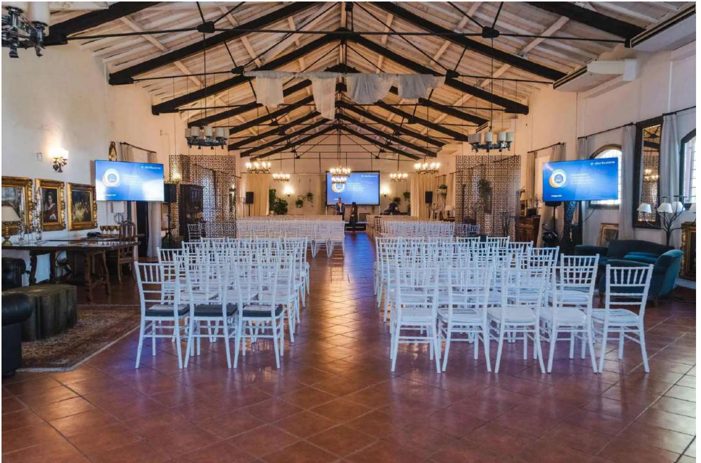
Le Scuderie San Carlo, Roma